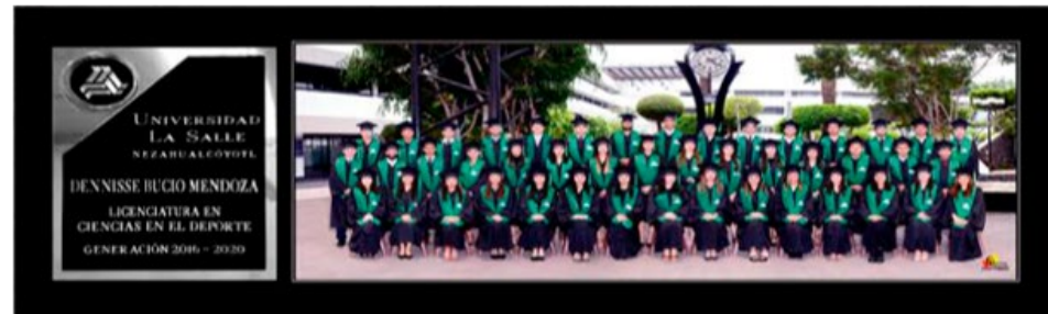
TOGA Y BIRRETE