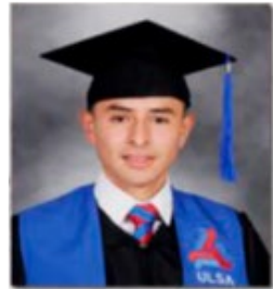
TOGA Y BIRRETE