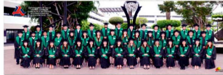
TOGA Y BIRRETE